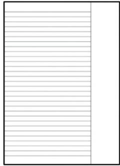
Hefte DIN/A4 kariert